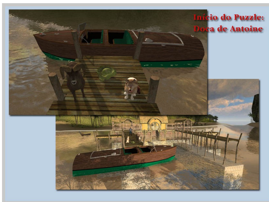
Ilustração 5: Cena do início do puzzle

Portanto, esses desafios - puzzles - foram propostos a partir de conceitos metodológicos lógicos, matemáticos e narrativos, sendo apresentados e refletidos pela equipe de roteiro no decorrer das reuniões, mas também por meio de um mail-list do grupo.