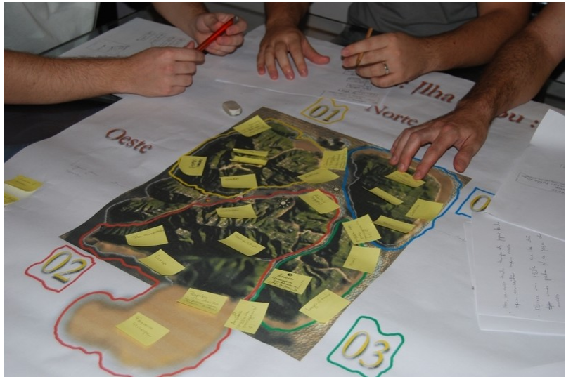
Ilustração 2: Mapa da Ilha Cabu com seus marcadores

Se entendermos narração como uma "sequência de eventos que exhibe o que acontece" (ASSIS, 2007, p.39), essa opção pode ter sido acertada em se tratando da produção de um game. Para marcar a localização no mapa de cada evento, objeto ou personagem, pensamos em utilizar miniaturas de objetos 20 . Na falta destes, usamos como marcação, nosso velho conhecido das leituras: o adesivo Post-it .