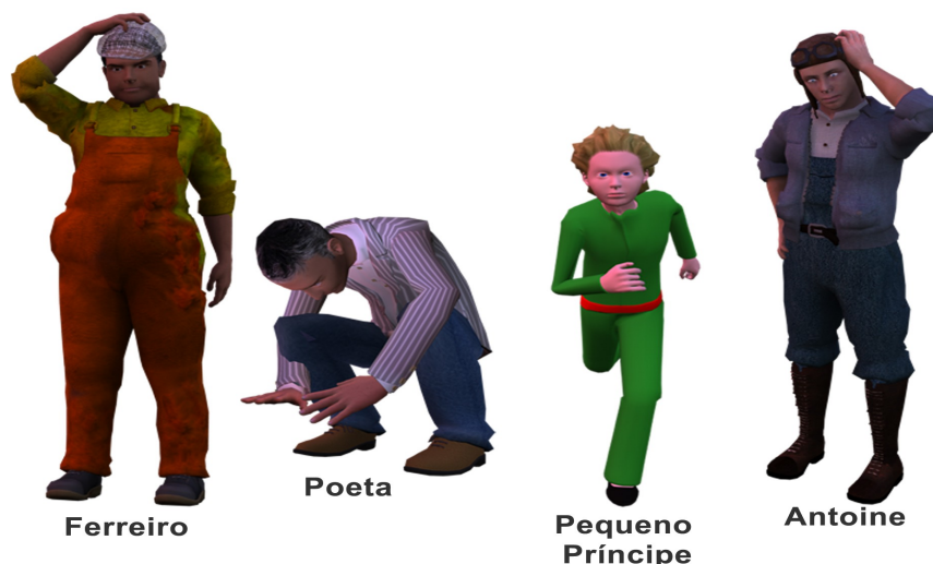
Ilustração 7: Alguns personagens da Ilha Cabu

Todo conceito possui uma estrutura tridimensional. Partindo desta reflexão heideggeriana, nosso