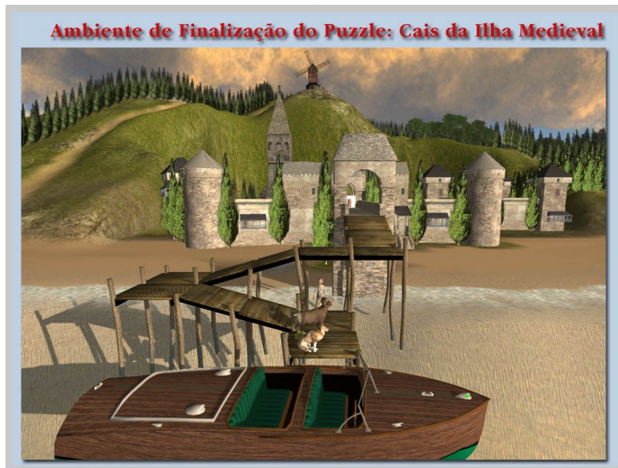
Ilustração 6: Cena de chegada à Vila Medieval

De forma mais elaborada, Tonéis (2010, p.114), dirá que "um puzzle se constitui em uma estrutura lógica organizada e aberta que encaminha um processo reflexivo que culmina na compreensão de um dado problema que se constitui no próprio puzzle ". Continua dizendo que o caminho da investigação e vivência de um puzzle tem seu apogeu em uma ampliação da experiência estética associada a ele, bem como em uma ampliação da potência de formular e resolver problemas. Assim um puzzle oferece, segundo Tonéis, uma abertura de mundo, na qual o processo de construção e re-construção de heurísticas, bem como o desenvolvimento do pensamento criativo encontram-se intrinsecamente desenvolvidos. Portanto, é no caminho da própria produção de conhecimento e em favor de seu constante crescimento e reflexão que os puzzles presentes na Ilha Cabu procuram oferecer momentos desafiadores e instigantes aos exploradores, àqueles que se aventuram no caminho da descoberta.