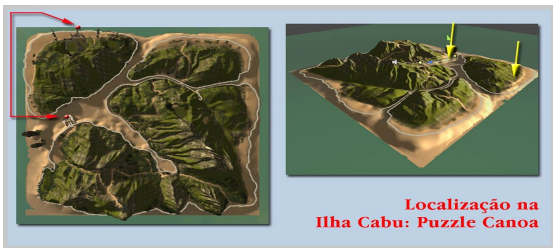
Ilustração 4: Trajeto para a realização do puzzle

Assim como toda pesquisa científica inicia-se por um problema a ser resolvido, uma questão a ser investigada - uma espécie de puzzle científico -, nosso desejo no game Ilha Cabu foi proporcionar ao navegador momentos de desafios e oportunidades para construções cognitivas, sejam estas referentes a narrativa em Cabu bem como ao resgate de conceitos supostamente já conhecidos.