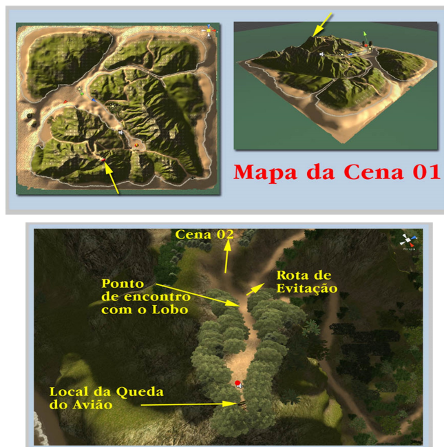
Ilustração 3: Mapa 3D da Ilha Cabu

Esse trabalho de localização das personagens, objetos e eventos na imagem 2D da Ilha, serviu de indicativo para os programadores situarem os eventos planejados, como vemos na ilustração 3.